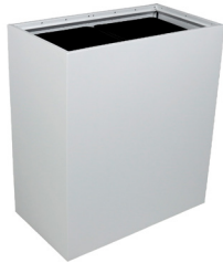
Double Accès par le haut

Les options de bâtis disponibles pour les séries Mezzo™ sont spécifiées ci-dessous. Ceci vous permettra de retrouver la bonne dimension pour le Mezzo™ qui s'adaptera le mieux à votre espace. Le guide de mesures est l'essence même des méthodes de mesures standards. Toutes les mesures indiquées sont en pouces. Renseignez-vous auprès de votre représentant des ventes dédié de Busch Systems® pour de plus amples renseignements sur la façon de sélectionner le conteneur de la bonne dimension pour votre espace.