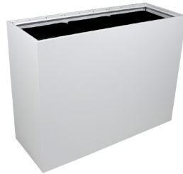
Triple Accès par le haut